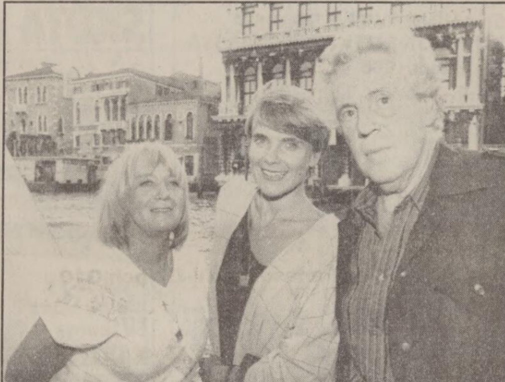
Mai Zetterlings "Amorosa" med Stina Ekblad och Erland Josephson har inte väckt pressens intresse på filmfestivalen i Venedig.

Så annorlunda kan alltså den Zetterlingska sjukdomstolkningen i "Amorosa" uppfattas av